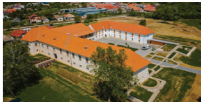
Rákocziho kaštieľ v Borši.