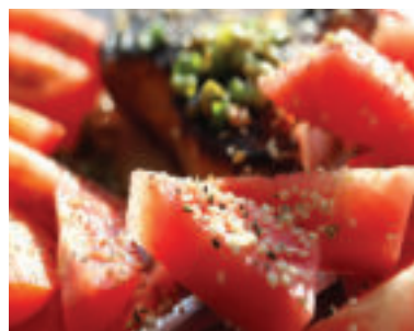
Melón si môžeme pripraviť aj na grile.