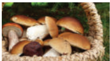
» ren Ilustračná foto.

„Pri podozrení na otravu hubami sa pokúste vyvolať u postihnutého vracanie a dopravte ho čo najskôr na lekárske ošetrovanie,“ radia odborníci a dodávajú, že je potrebné priniesť so sebou aj zvyšky húb alebo zvratok, aby sa dal určiť druh huby. „Nedávajte postihnutému jesť ani piť, a už vôbec nie alkohol,“ prízvukujú odborníci z SČK.