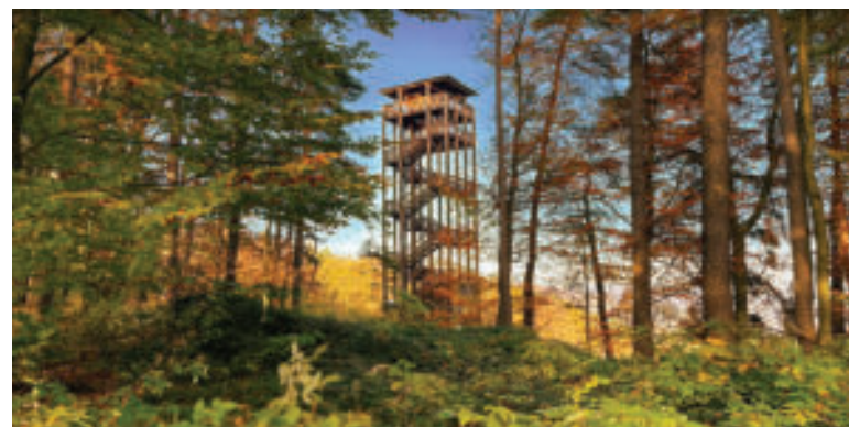
Rozhľadňa Malý Jelenec.