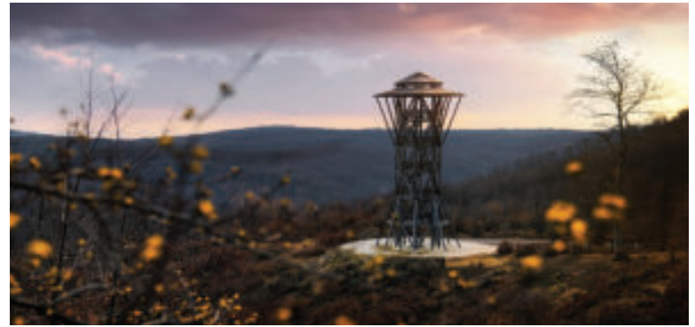
Rozhľadňa pod Klenovou.

Ako prístupovú cestu k rozhľadni môžete použiť náučný chodník „Tri skaly“, roz-