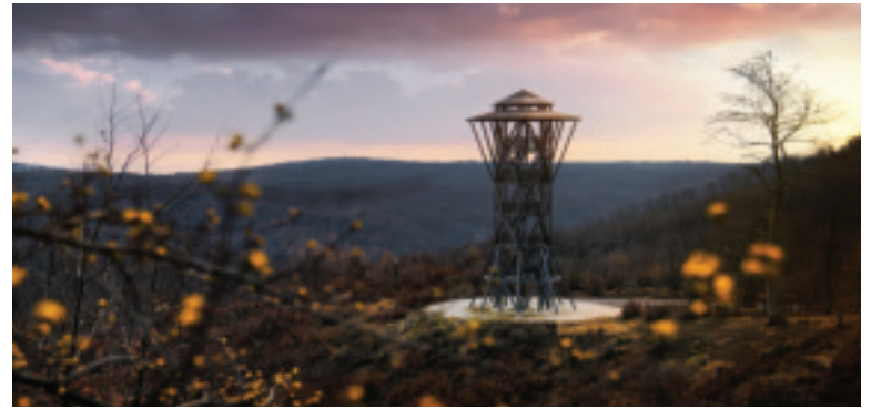
Rozhľadňa pod Klenovou.

Ako prístupovú cestu k rozhľadni môžete použiť náučný chodník „Tri skaly“, roz-