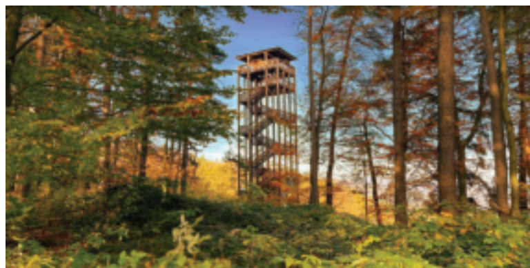
Rozhľadňa Malý Jelenec.