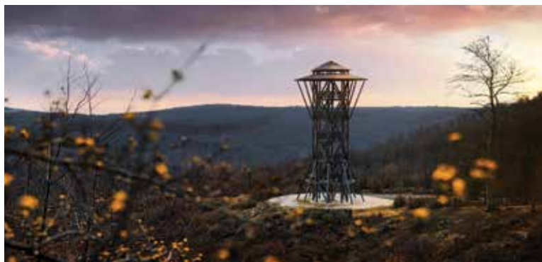
Rozhľadňa pod Klenovou.

Ako prístupovú cestu k rozhľadni môžete použiť náučný chodník „Tri skaly“, roz-