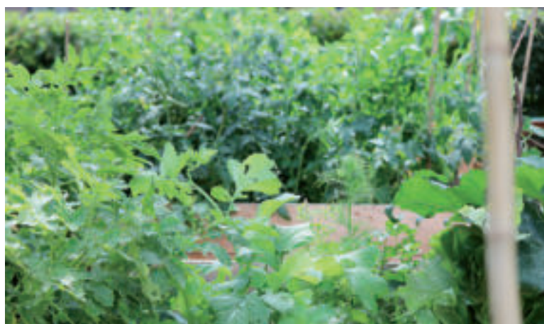
Zelené hnojenie je pre záhradu prospešné.