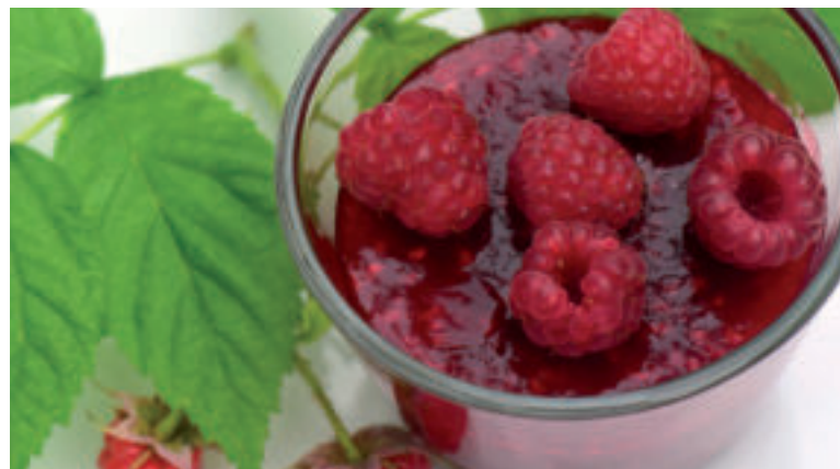
Malinový džem s mäťou je osviežujúci.

Postup: Figy umyte, zbavte ich stoniek a nakrájajte na menšie kúsky. Vložte ich do misy, zasypte cukrom, pridajte k nim kôru