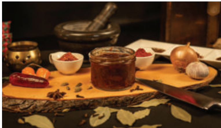
Cibuľové čatní chutí skvelo.

• Hotové čatní plňte do zaváracích pohárov, ktoré po uzatvorení obráťte na 15