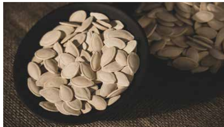
Tekvicové semiačka sú plné vitamínov.

• Tekvicu umyte, očistite, lyžicou z nej odstráňte semiačka aj mäkké vnútro či dužinu a pokrájajte na kocky. Papriku umyte, cibuľu a cesnak očistite a všetko pokrájajte na menšie kocky. Na panvici si rozohrejte olej, vložte zeleninu a duste do mäkkka, približne hodinu.