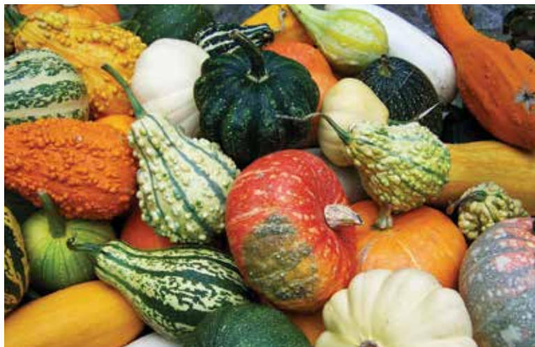
Tekvice sú neodmysliteľnou súčasťou jesene.

Tekvice zbierame postupne ako dozrievajú, zvyčajne počas celého leta a jesene. To, že je už tekvica vhodná na zber, nám pomôže určiť jej schnúca stopka.