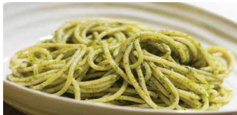
Pesto z tekvicových semiačok môžete použiť na ochutenie cestovín.

Suroviny: 1 menšiu bielu tekvicu, 1 cibuľu, 4 mrkvy, 3 menšie zemiaky, olej, soľ, vodu, tekvicové semiačka