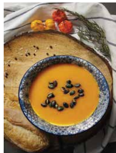
Tekvicovú polievku môžete pri servírovaní ozdobiť tekvicovými semiačkami.