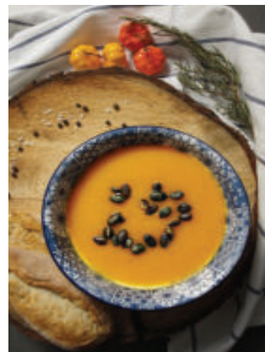
Tekvicovú polievku môžete pri servírovaní ozdobiť tekvicovými semiačkami.