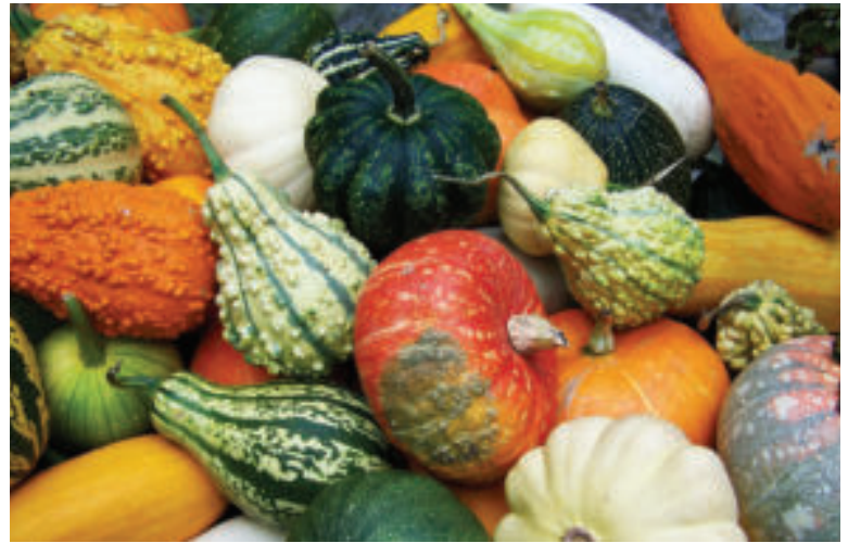
Tekvice sú neodmysliteľnou súčasťou jesene.

Tekvice zbierame postupne ako dozrievajú, zvyčajne počas celého leta a jesene. To, že je už tekvica vhodná na zber, nám pomôže určiť jej schnúca stopka.