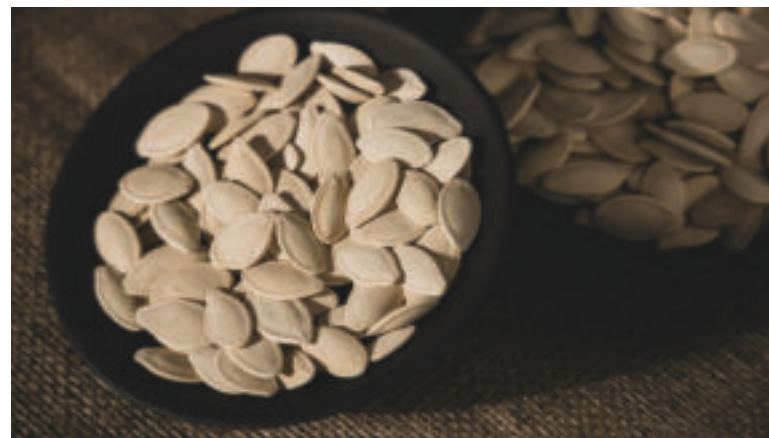
Tekvicové semiačka sú plné vitamínov.

• Tekvicu umyte, očistite, lyžicou z nej odstráňte semiačka aj mäkké vnútro či dužinu a pokrájajte na kocky. Papriku umyte, cibuľu a cesnak očistite a všetko pokrájajte na menšie kocky. Na panvici si rozohrejte olej, vložte zeleninu a duste do mäkka, približne hodinu.