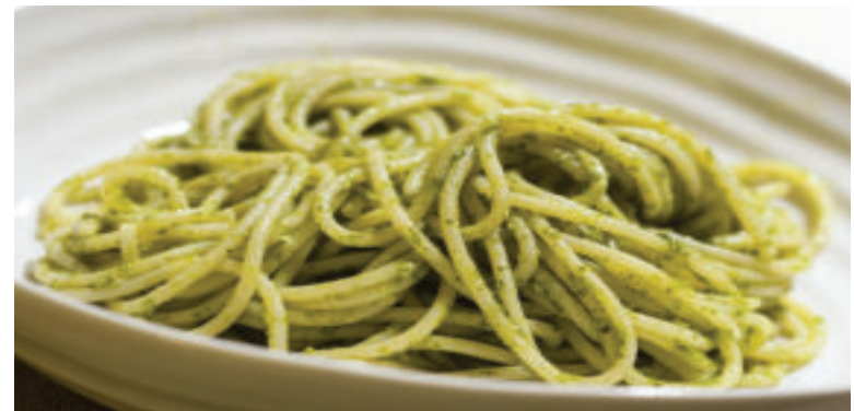
Pesto z tekvicových semiačok môžete použiť na ochutenie cestovín.

Suroviny: 1 menšiu bielu tekvicu, 1 cibuľu, 4 mrkvy, 3 menšie zemiaky, olej, soľ, vodu, tekvicové semiačka