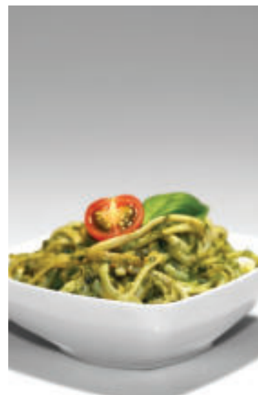
Pesto sa veľmi hodí na ochutenie varených cestovín.

Ponúkame vám jednoduchý recept na rýchlu večeru, ktorá isto nesklame: