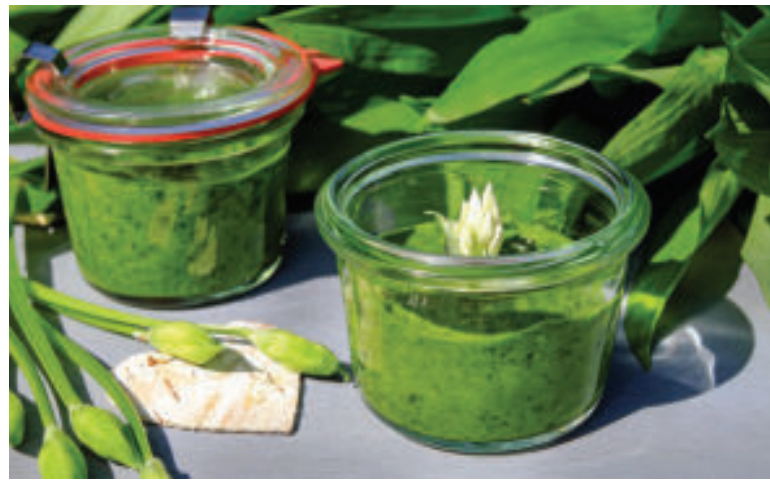
Pesto z medvedieho cesnaku.

Čerstvú petržlenovú vňať umyte pod tečúcou vodou a poriadne osušte. Do kuchynského elektrického sekáčika alebo mixéra vložte cesnak, vlašské orechy a dôkladne rozsekajte. Postupne po dávkach pridávajte petržlenovú vňať a prilievajte olivový olej. Nakoniec pridajte strúhaný parmezán, pár kvapiek citrónovej šťavy, soľ, mleté čierne korenie a domixujte.