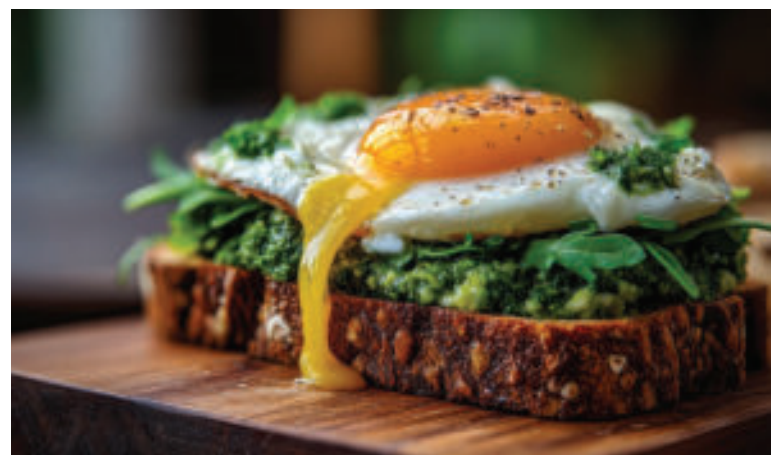
Pesto chutí výborne aj s hriankou.