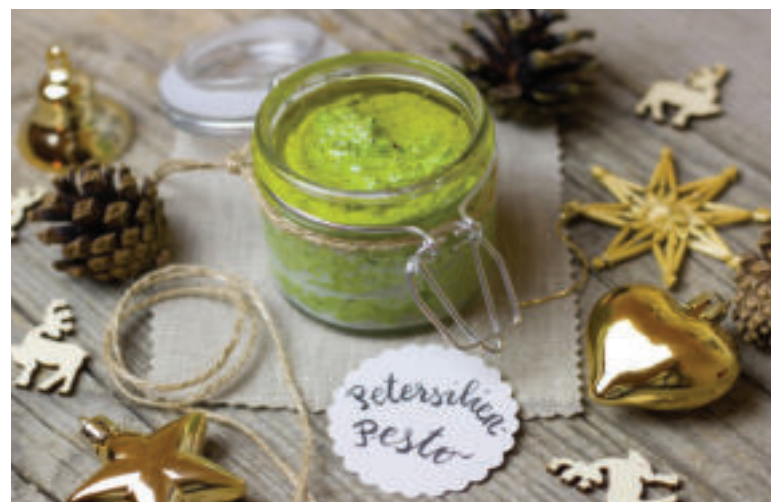
Pesto môže poslúžiť aj ako originálny darček.

Medvedí cesnak poriadne umyte pod tečúcou vodou a dobre osušte. Následne ho vložte do mixéra, pridajte soľ podľa chuti, obľúbený druh