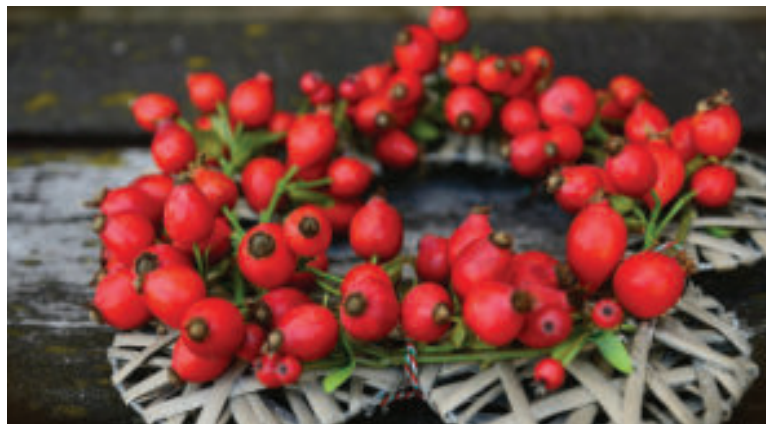
Zo šípkov si môžete vyrobiť aj peknú jesennú dekoráciu.

• Následne je podľa odborníčky potrebné dosušiť šípky umelým teplom v rúre, aby pre dlhé sušenie zbytočne nesplesnivali. Pozor ale na teplotu, ktorá nesmie presiahnuť 35°C, aby sa v nich zachovalo čo najviac vitamínov. Plody, priebežne kontrolujte - nesmú zhnednúť alebo sa pripáliť. „Platí že, suchá šípka je krehká a mala by