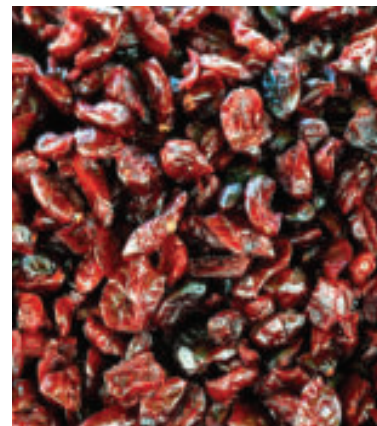
Šípky sušime v jednej vrstve rozložené na sito alebo plechu.

• Plody šípok očistite, umyte, osušte a rozdrvte tyčovým mixérom. Následne ich zalejte pol litrom vody a povarte 10 minút.