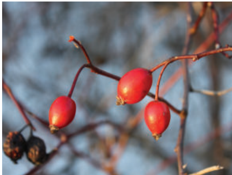
Nazbierajte si šípky.