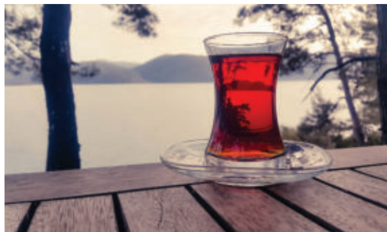
Vychutnajte si šípkový čaj.