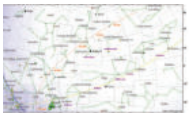
Vyhľadávacia mapka kométy C/2025 A6 (oranžová čiara s dátumami) v októbri a novembri 2025.