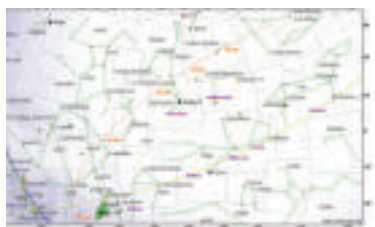
Vyhľadávacia mapka kométy C/2025 A6 (oranžová čiara s dátumami) v októbri a novembri 2025.