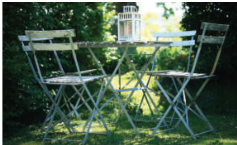
Uskladnite záhradný nábytok.

Vodu zo sústavy záhradného vodovodu pred zimou vypustite a uzavrite vodovodné kohútiky. Polievacie hadice odložte na suché miesto.