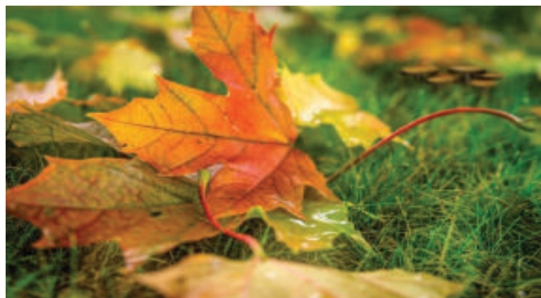
Postarajte sa o opadané lístie.

Náš tip: V našich podmienkach sa najčastejšie pestujú jablká, hrušky, marhule, slivky, broskyne či čerešne. V južnejších oblastiach môžete byť aj