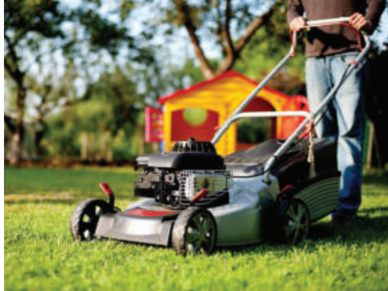
Trávnik pred zimou poslednýkrát pokoste.

Ideálnym obdobím na sadenie ovocných stromov a kríkov je podľa odborníkov október a začiatok novembra. Ak teda túžite po vlastnej úrode ovocia