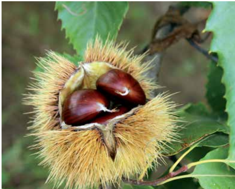
Gaštaný sú plody gaštana jedlého.

Gaštaný narežte ostrým nožom na špičke do krížika. Rezy by mali byť hlboké asi 4 až 5 mm, aby sa gaštaný po upečení dali dobre ošúpať. Takto narezané ich vložte do hrnca, zalejte studenou vodou, pridajte môžete aj trošku soli a dajte variť. Keď voda chvíľu vrie, gaštaný odstavte zo sporáka a