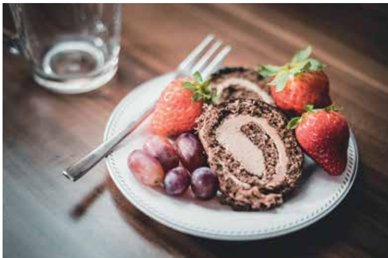
Gaštaný sa hodia na prípravu chutných dezertov.