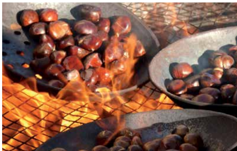
Vychutnajte si pečené gaštaný.

Na polevu: 100 g čokolády na varenie, 80 ml smotany na šľahanie