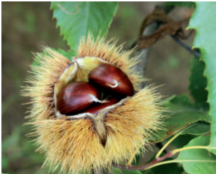
Gaštaný sú plody gaštana jedlého.

Gaštaný narežte ostrým nožom na špičke do krížika. Rezy by mali byť hlboké asi 4 až 5 mm, aby sa gaštaný po upečení dali dobre ošúpať. Takto narezané ich vložte do hrnca, zalejte studenou vodou, pridajte môžete aj trošku soli a dajte variť. Keď voda chvíľu vrie, gaštaný odstavte zo sporáka a