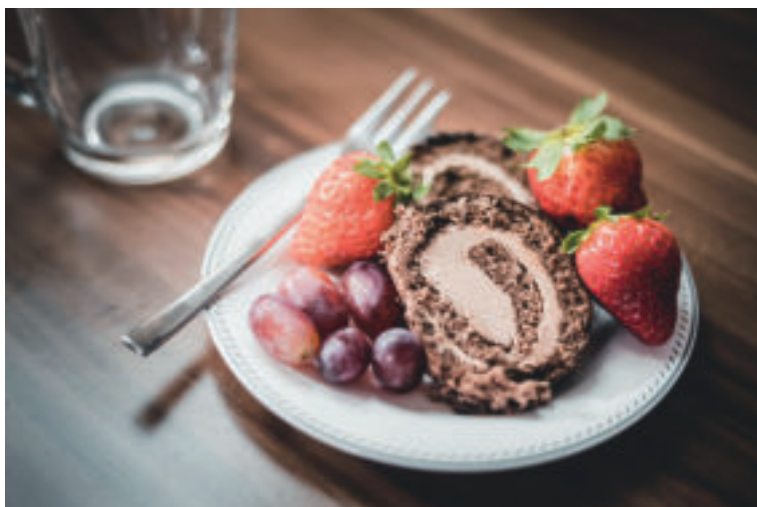
Gaštaný sa hodia na prípravu chutných dezertov.

Suroviny: 120 g piškóty, 250 g gaštanového pyré, 1 vanilkový cukor, 2 lyžice práškový cukor, 40 g maslo, 1 lyžica rumu, 100 ml smotany na šľahanie, 50 g čokolády