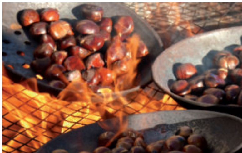
Vychutnajte si pečené gaštaný.