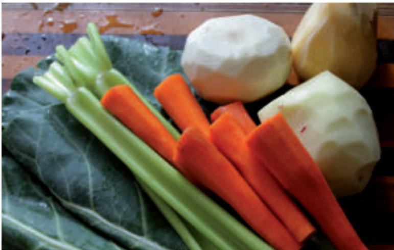
Bez zeleru sa nezaobíde takmer žiadna zeleninová polievka.

Buľvy zeleru môžeme zberať postupne ako dorastajú. Všetky zvyšné buľvy môžeme potom vykopať na jeseň, v októbri či začiatkom novembra a uskladniť ich v debničkách zasypané vrstvou piesku v chladnej tmavej a dobre vetrajúcej pivnici.