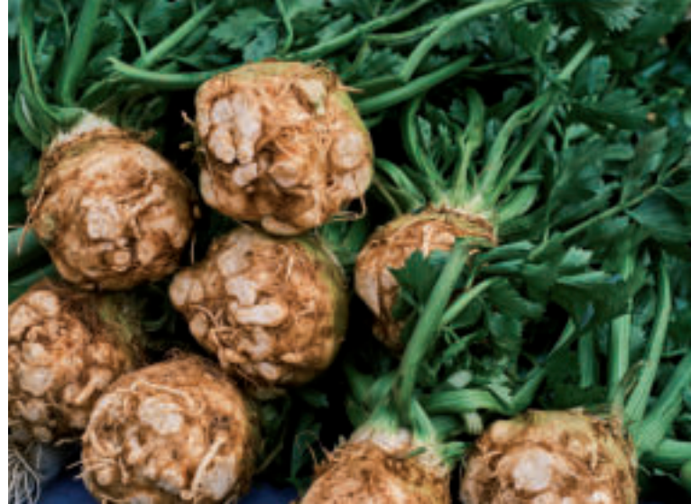
Zeler si môžeme dopestovať aj v našej záhrade.

Suroviny: 700 g zeleru, 350 ml mlieka, 150 ml smotany na šľahanie, 100 g šalotky, 20 g masla, soľ, mleté čierne korenie