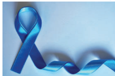
Ilustračná foto.

Na Slovensku sa pripravuje zavedenie organizovaného skriningu rakoviny prostaty. „V rámci skriningu budú zdravotními poisťovňami aktívne oslovení a pozývaní muži bez príznakov vo vekovej skupine 50 až 70 rokov na absolvovanie testu na vyšetrenie hladiny PSA v krvi,“ uzavrel rezort zdravotníctva.