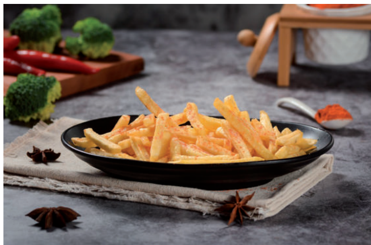
Pripravte si zelerové hranolky.