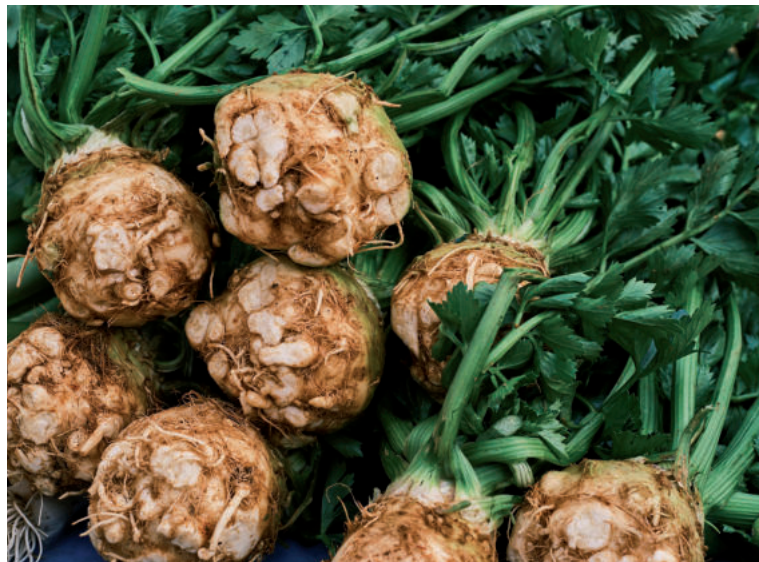
Zeler si môžeme dopestovať aj v našej záhrade.

Suroviny: 700 g zeleru, 350 ml mlieka, 150 ml smotany na šľahanie, 100 g šalotky, 20 g masla, soľ, mleté čierne korenie