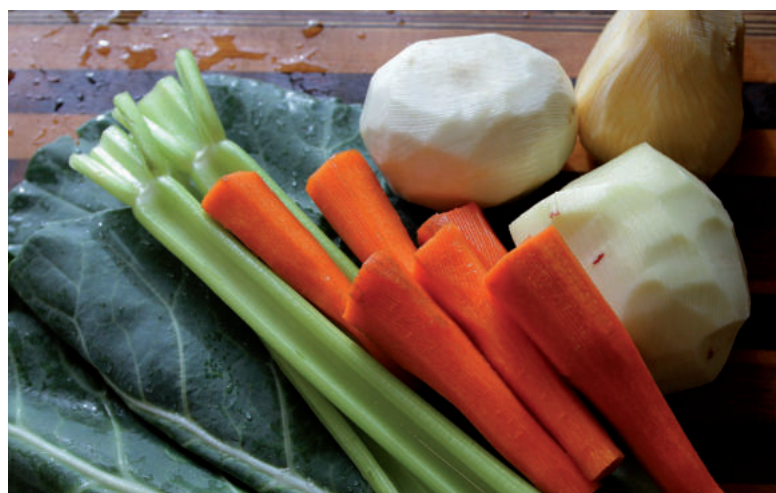
Bez zeleru sa nezaobíde takmer žiadna zeleninová polievka.

Buľvy zeleru môžeme zberať postupne ako dorastajú. Všetky zvyšné buľvy môžeme potom vykopať na jeseň, v októbri či začiatkom novembra a uskladniť ich v debničkách zasypané vrstvou piesku v chladnej tmavej a dobre vetrajúcej pivnici.