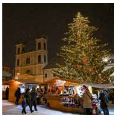
Vianočné trhy v Banskej Bystrici.