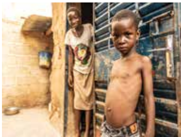
zdvoj foto ACN » ACN