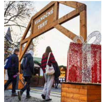
Vianočné trhy v Žiline.

Banskobystrické Vianoce budú aj o spájaní. Z iniciatívy kresťanov mesta bude predvianočný čas patriť aj ekumenickým modlitbám v Kostole nanebovzatia Panny Márie. Počas sviatočného obdobia sa môžu návštevníci tešiť aj na Pastierske Vianoce, zamerané na vianočné a duchovné zvyky našich predkov v Kostole Panny Márie Pomocnice kresťanov na Tatranskej ulici, či na banické koledy