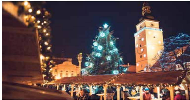
Vianočné trhy v Trnave.