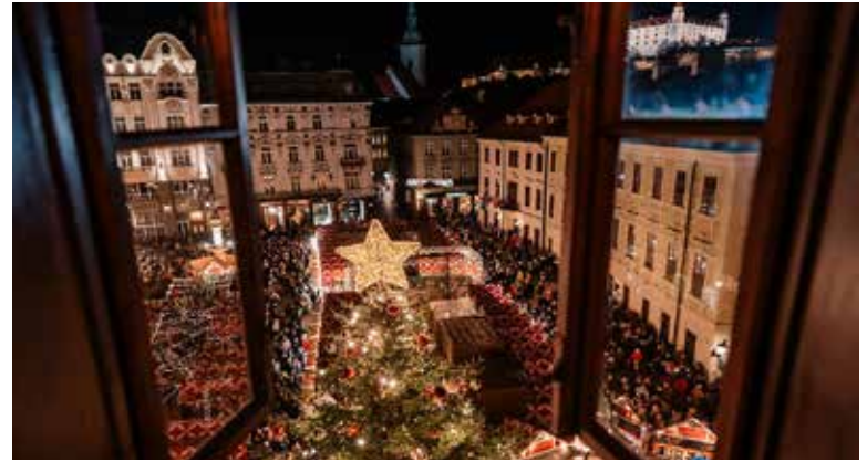
Vianočné trhy v Bratislave.

Otvorenie Adventných trhov v Trnave sa uskutoční v piatok 28. novembra o 17.30 h. Advent odštartuje sprievod s anjeli a dychovým orchestrom, ktorý prejde mestom a napokon rozsvieti 12-metrový vianočný strom na