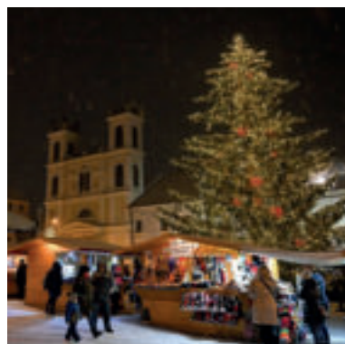
Vianočné trhy v Banskej Bystrici.