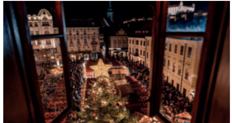
Vianočné trhy v Bratislave.

Otvorenie Adventných trhov v Trnave sa uskutoční v piatok 28. novembra o 17.30 h. Advent odštartuje sprievod s anjeli a dychovým orchestrom, ktorý prejde mestom a napokon rozsvieti 12-metrový vianočný strom na