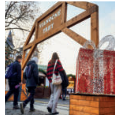
Vianočné trhy v Žiline.

Banskobystrické Vianoce budú aj o spájaní. Z iniciatívy kresťanov mesta bude predvianočný čas patriť aj ekumenickým modlitbám v Kostole nanebovzatia Panny Márie. Počas sviatočného obdobia sa môžu návštevníci tešiť aj na Pastierske Vianoce, zamerané na vianočné a duchovné zvyky našich predkov v Kostole Panny Márie Pomocnice kresťanov na Tatranskej ulici, či na banické koledy