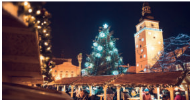
Vianočné trhy v Trnave.