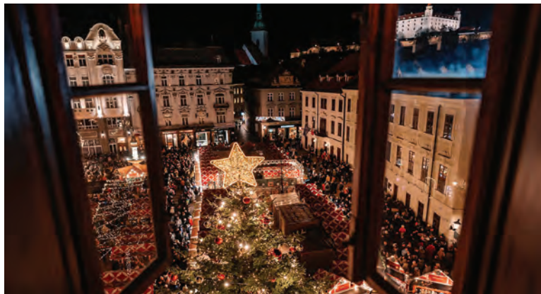
Vianočné trhy v Bratislave.