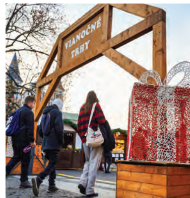
Vianočné trhy v Žiline.

Banskobystrické Vianoce budú aj o spájaní. Z iniciatívy kresťanov mesta bude predvianočný čas patriť aj ekumenickým modlitbám v Kostole nanebovzatia Panny Márie. Počas sviatocného obdobia sa môžu návštevníci tešiť aj na Pastierske Vianoce, zamerané na vianočné a duchovné zvyky našich predkov v Kostole Panny Márie Pomocnice kresťanov na Tatranskej ulici, či na banické koledy