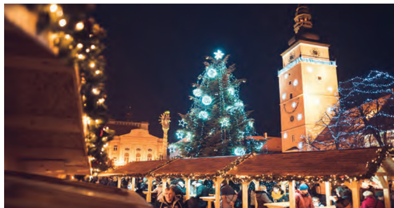
Vianočné trhy v Trnave.

Otvorenie Adventných trhov v Trnave sa uskutoční v piatok 28. novembra o 17.30 h. Advent odštartuje sprievod s anjeli a dychovým orchestrom, ktorý prejde mestom a napokon rozsvieti 12-metrový vianočný strom na