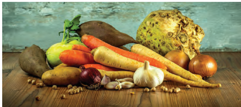
V jedálničku diabetika by nemala chýbať zelenina.

U zdravých ľudí sa hladina cukru v krvi nalačno pohybuje v rozmedzí 3,3 - 5,6 mmol/l. Zvýšenie hladiny cukru v krvi nalačno u zdravého človeka nad 5,6 mmol/l alebo po jedle nad 7,8 mmol/l sa nazýva hyperglykémia. „Hyperglykémia je základným prejavom cukrovky. Krátkotrvajúca zvýšená koncentrácia cukru v krvi nie je obvykle vážnym stavom, avšak dlhodobé zvýšenie hladiny cukru v krvi vedie k vzniku vážnych komplikácií,“ objasnili na sociálnej sieti odborníci z Regionálneho úradu verej-