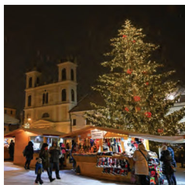
Vianočné trhy v Banskej Bystrici.

Informácie poskytl Mesto Banská Bystrica