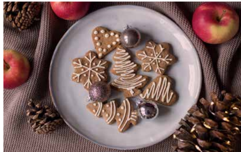
Upečte si voňavé medovníčky.