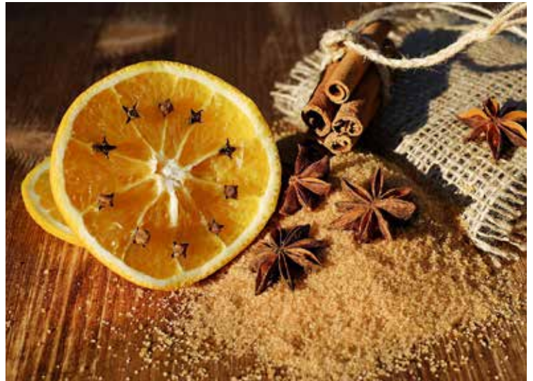
Vianočné korenie má veľa priaznivých účinkov na naše zdravie.

Škorica má antibakteriálne a antivírusové účinky, no tiež v sebe ukrýva množstvo antioxidantov. Táto aromatická korenina nám pomáha zdolať