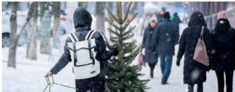
Živý vianočný stromček dodá nášmu príbytku autentickú vianočnú vôňu.

V prípade živého vianočného stromčeka môžeme siahnuť aj po stromčeku v črepníku a tešiť sa tak z jeho krásy aj v budúcnosti. Na jar ho môžeme premiestniť na balkón či terasu, alebo ho presadiť do záhrady. V takom prípade však dobre zvážte, aký druh si zvolíte, aby po čase