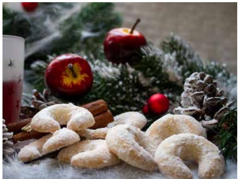
Mandľové rožtky isto nesklamú.

Badián je známy svojimi antioxidantnými, protizápalovými a antimikrobiálnymi vlastnosťami a antivírusovými účinkami. Pomáha nám pri prechladnutí a zlepšuje trávenie.