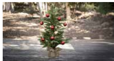
Zvoliť môžeme aj vianočný stromček v črepníku.

V prípade rezaného vianočného stromčeka voľba zvyčajne padá na smrek, borovicu a jedličku. A práve normandská jedlička môže byť dobrou voľbou. Má peknú zelenú farbu ihličia, krásne vonia a pomerne dlho vydrží čerstvá. Naopak, smrek obyčajný opadá veľmi rýchlo, zaujímavá však môže byť jeho cena. Ak sa rozhodnete pre borovicu čiernu myslíte na to, že tento strom potrebuje viac priestoru. Odmení sa vám však úžasnou vôňou. Jeho ihličie je krásne dlhé a výhodou je, že neopadá