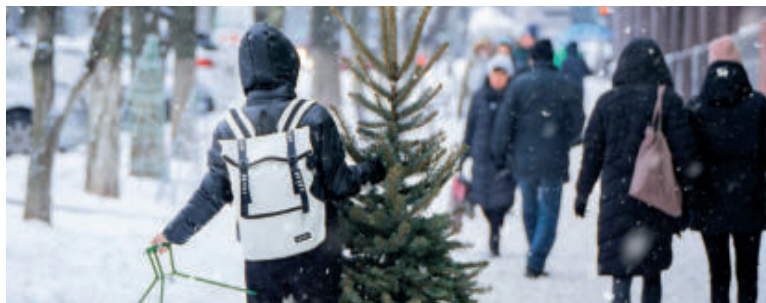
Živý vianočný stromček dodá nášmu príbytku autentickú vianočnú vôňu.

V prípade živého vianočného stromčeka môžeme siahnuť aj po stromčeku v črepníku a tešiť sa tak z jeho krásy aj v budúcnosti. Na jar ho môžeme premiestniť na balkón či terasu, alebo ho presadiť do záhrady. V takom prípade však dobre zvážte, aký druh si zvolíte, aby po čase