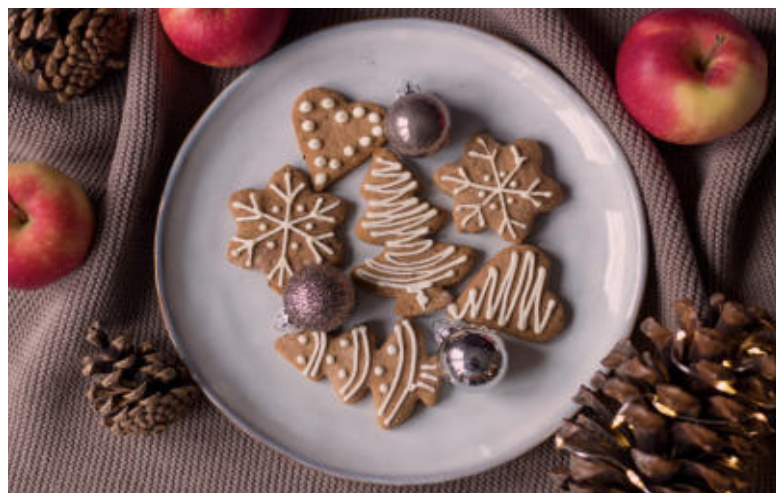
Upečte si voňavé medovníčky.