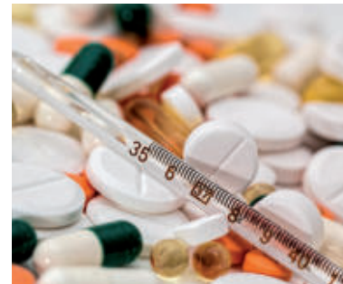
Ilustračné foto.

hygienu i respiračnú etiketu (kýčajte a kašlite do jednorazovej hygienickej vreckovky, ak vreckovku nemáte po ruke, prekryte si ústa aspoň laktovou jamkou). Ak je to potrebné, izolujte sa od ostatných ľudí, čím zabránite šíreniu infekcií.