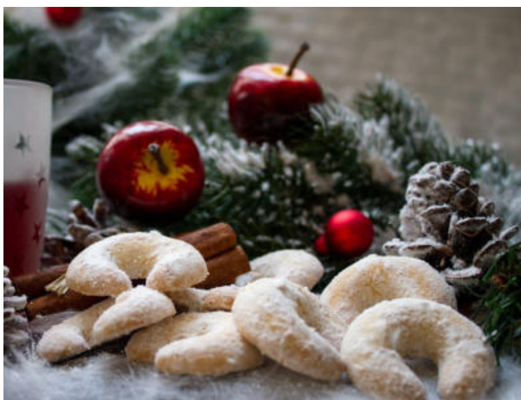
Mandľové rožtky isto nesklamú.

Badián je známy svojimi antioxidantnými, protizápalovými a antimikrobiálnymi vlastnosťami a antivírusovými účinkami. Pomáha nám pri prechladnutí a zlepšuje trávenie.