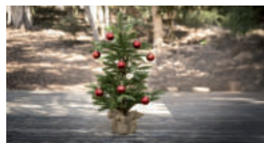
Zvoliť môžeme aj vianočný stromček v črepníku.

V prípade rezaného vianočného stromčeka voľba zvyčajne padá na smrek, borovicu a jedličku. A práve normandská jedlička môže byť dobrou voľbou. Má peknú zelenú farbu ihličia, krásne vonia a pomerne dlho vydrží čerstvá. Naopak, smrek obyčajný opadá veľmi rýchlo, zaujímavá však môže byť jeho cena. Ak sa rozhodnete pre borovicu čiernu myslíte na to, že tento strom potrebuje viac priestoru. Odmení sa vám však úžasnou vôňou. Jeho ihličie je krásne dlhé a výhodou je, že neopadá