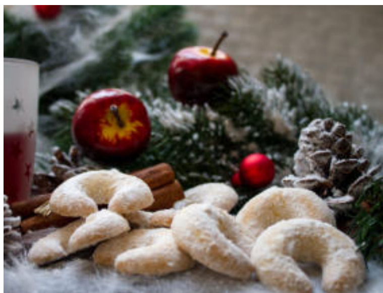
Mandľové rožtky isto nesklamú.

Badián je známy svojimi antioxidantnými, protizápalovými a antimikrobiálnymi vlastnosťami a antivírusovými účinkami. Pomáha nám pri prechladnutí a zlepšuje trávenie.