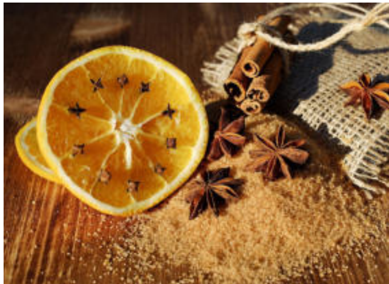
Vianočné korenie má veľa priaznivých účinkov na naše zdravie.

Škorica má antibakteriálne a antivírusové účinky, no tiež v sebe ukrýva množstvo antioxidantov. Táto aromatická korenina nám pomáha zdolať