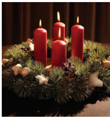
Ilustračné foto.