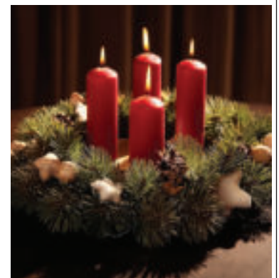
Ilustračné foto.