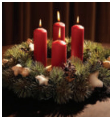
Ilustračné foto.