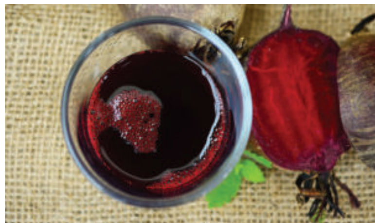
S cviklovou šťavou začínajte postupne.

• Cviklu by nemali konzumovať ľudia trpiaci obličkovými kameňmi či nízkym