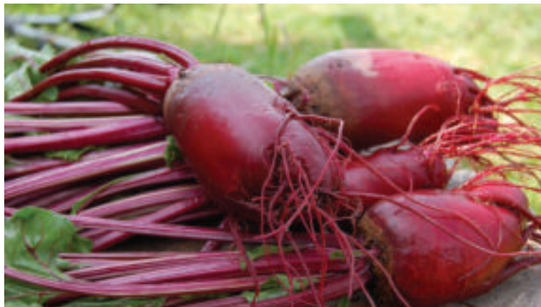
Cviklu si dopestujeme aj v záhrade.

Cvikla je výborná surová, varená aj pečená, môžeme ju však aj zavárať. Zo surovej si môžete pripraviť šťavu či smoothie. Odborníci však radi konzumovať ju skôr tepelne upravenú. Po tom ako cviklu umyjete pod tečúcou vodou, varte ju v dostatočnom množstve vody asi hodinu alebo pečte