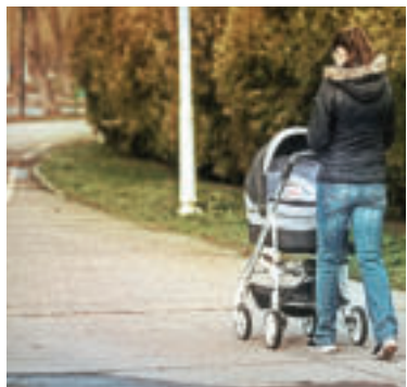
Ilustračné foto.