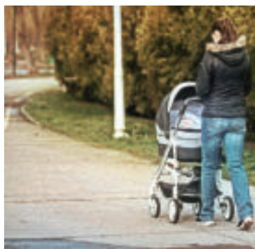
Ilustračné foto.