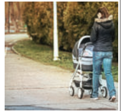
Ilustračné foto.