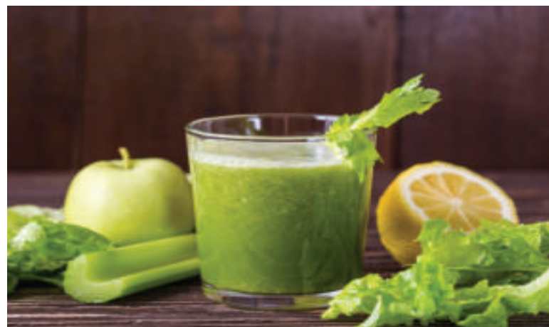
Osviežiť nás môže aj jablková šťava.

• Jablká umyjeme, očistíme, rozdelíme na polovice a z každej z nich vykrojíme jad-