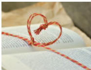
Ilustračné foto.

Kampaň Valentínska kvapka krvi® je zapísaná v registri ochranných známk Úradu priemyselného vlastníctva SR.