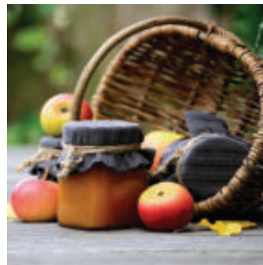
Jablká sa hodia aj na zaváranie.

• Z vaječného bielka a práškového cukru ušľaháme tuhý sneh. Na každé jablko dáme kôpku snehu - čiapku a posypeme nasekanými mandľami alebo vlašskými orechmi. Poukladáme na maslom vymastený pekáč a pečieme domäkka.