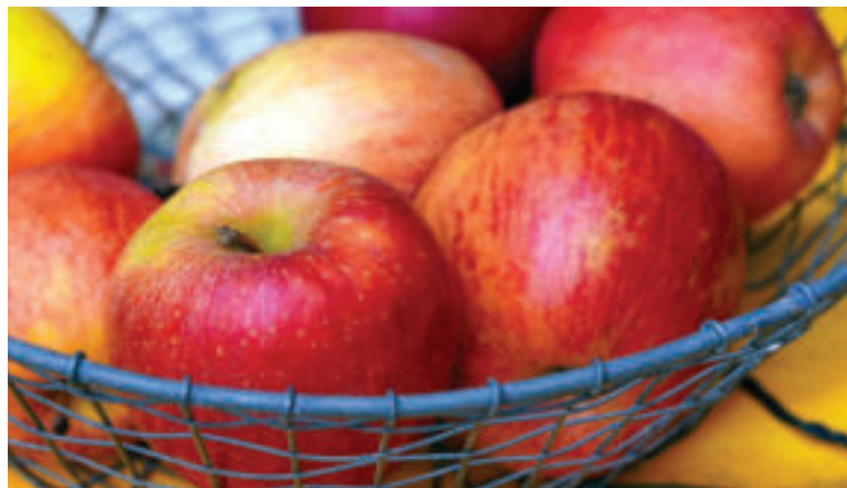
Doprajme si chutné šťavnaté jablká.

Jablká môžeme konzumovať čerstvé, ale hodia sa aj do rôznych ovocných či ovocno-zeleninových štiav a šalátov. Veľmi často ich však najmä v zimných mesiacoch vyu-