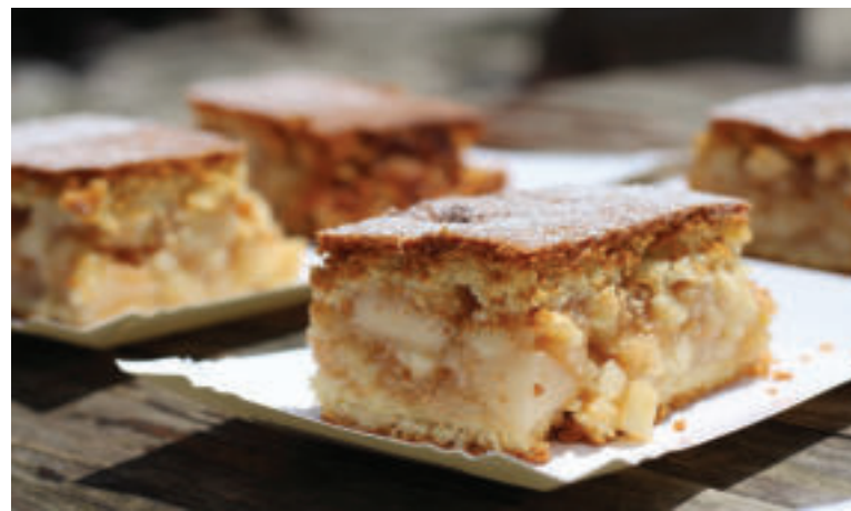
Jablkové pité chutí skvelo.

Na mrveničku: 75 g maslo, 65 g ovsené vločky – nahradiť ich môžete orechmi, 110