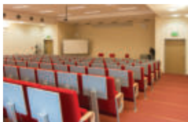
Ilustračné foto.