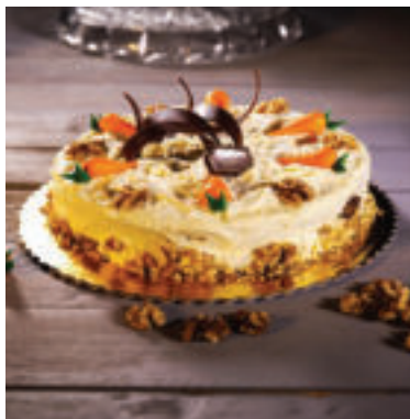
Upečte si netradičnú mrkvoovú tortu.

• Upečený mrkvoový koláč necháme vychladnúť a potom potrieme krémom. Následne ho necháme chvíľu stuhnúť, potom nakrájame a ozdobíme napríklad nasekanými orechmi, sušenými ovocím alebo kokosovými lupienkami.