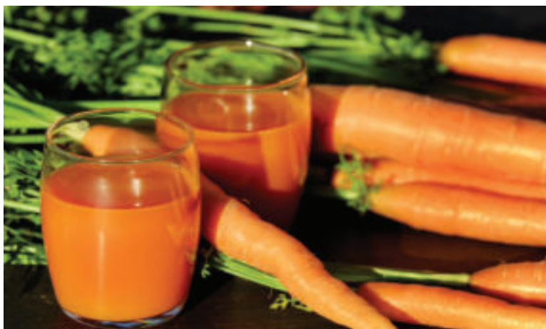
Mrkvoová šťava je plná vitamínov.