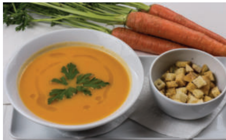
Mrkva je súčasťou mnohých pokrmov.