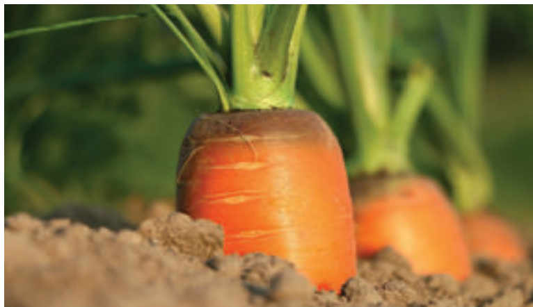
Mrkvu si môžeme dopestovať aj v našej záhrade.

Mrkva je chuťovo výborná zelenina a môžeme ju konzumovať v surovom