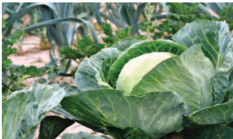
Kapustu si môžeme dopestovať aj v našej záhrade.

Na oleji speníme cibuľu, pridáme papriku a na kocky pokrúpané mäso. Popražíme, podlejeme vodou a dusíme.