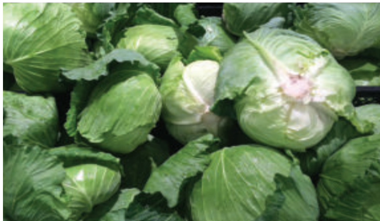
Kapusta je zdravá zelenina plná vitamínov.