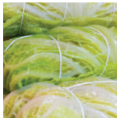
Pripraviť si môžeme aj plnené kapustné listy.