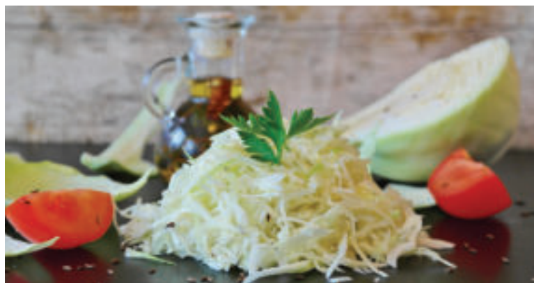
Kapusta má v našej kuchyni všestranné použitie.

Suroviny: 700 g mletého mäsa, 8 listov z bielej hlávkovej kapusty, 2 vajcia, sladká mletá červená paprika, sušený majorán, 4 strúčiky cesnaku, 2 menšie cibule,