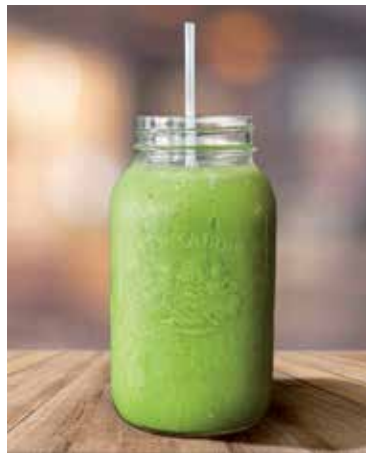
Pomelo využijete aj pri príprave smoothie.

na zdravie je podľa nej toto citrusové ovocie výbornou súčasťou vyvázenej stravy.