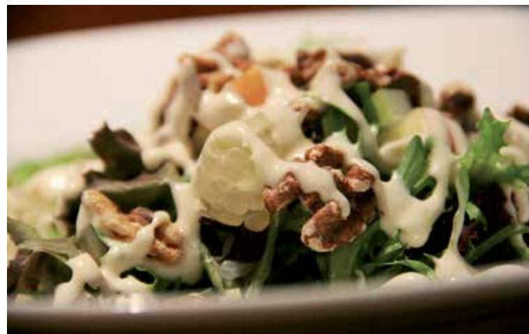
Pomelo sa hodí do šalátov.

Pomelo najskôr očistíme od hrubej vrchnej šupky, následne ho zbavíme aj tenkej bielej šupky, dužinu natrháme na kúsky a vložíme do misy. Pridáme od šupky očistené mandarínky rozdelené na jednotlivé mesiaciky, a jablko nakrájané na kocky aj so šupou. Z fenikla očistíme vrchné listy, nakrájame na jemné pásiky a pridáme k šalátu. Následne dáme do misy aj nasekané vlašské orechy a na kúsky pokrýjaný alebo medzi prstami podrvený syr balkánskeho typu. Dochutíme zálievkou, ktorú sme si pripravili z citrónovej šťavy a medu. Všetko spolu dobre premiešame.