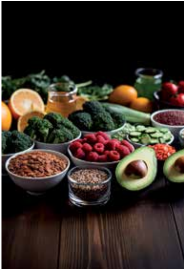
Zaradte do jedálnečka potraviny bohaté na vlákninu.

Vláknina má vplyv na látkovú premenu a činnosť tráviaceho systému. Podporuje činnosť žalúdka aj čriev – zlepšuje trávenie a pomáha pri vyprázdňovaní. Výrazne znižuje hladiny cholesterolu v krvi a znižuje riziko vzniku srdcovocievnych ochorení. „Jej