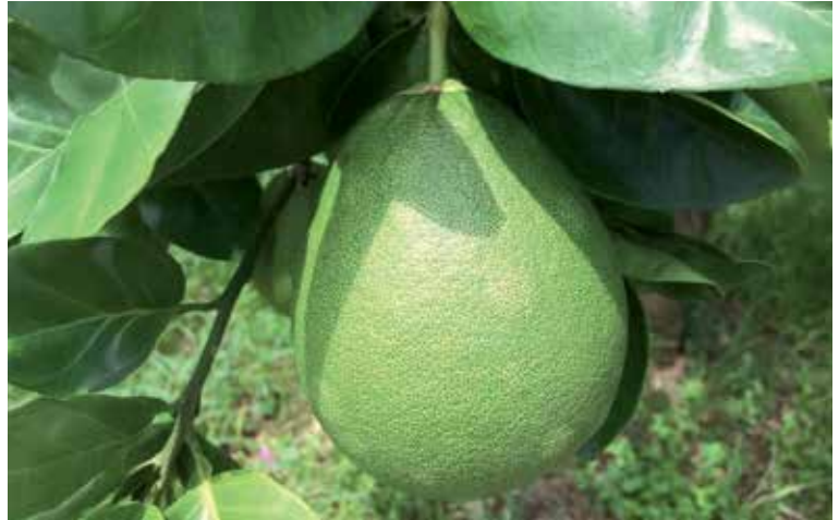
Pomelo je zdravé a plné vitamínov.