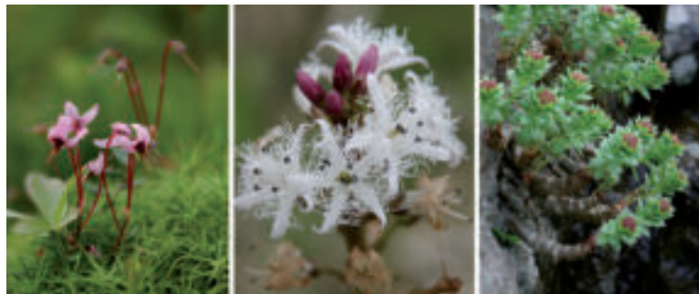
Fotografie rastlinných druhov: kľukva močiarna, vachta trojlístá, rozchodnica ružová.

Aj na Slovensku máme viacero ohrozených druhov. Tie najviac ohrozené rastlinné a živočíšne druhy sú uvedené v Červených zoznamoch Slovenska. Do kategórie kriticky ohrozený druh patrí napríklad svišť tatran-