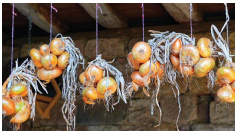
Cibuľu môžeme sušiť vo zväzkoch.

Suroviny: 2 väčšie cibule, 500 ml vody, med a citrón na ochutenie.