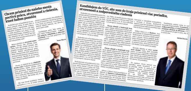
Štvrtstranový PR článok

Nástroj pre efektívnu komunikáciu s občanmi