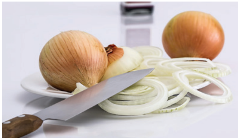
Cibuľa je veľmi prospešná pre naše zdravie.

• Cibuľu môžeme zberať priebežne, podľa potreby, ale na uskladnenie ju zberáme až keď začnú listy postupne žltnúť, schnúť, až si napokon lahnú. Plody vyberieme z pôdy aj s vňaťou a rukami ich očistíme od zvyškov zeminy. Ak je snečné počasie bez zrážok, necháme cibuľu dosušiť priamo na hriadkach, v prípade daždivého počasia jej musíme nájsť suché dobre vetrané miesto.