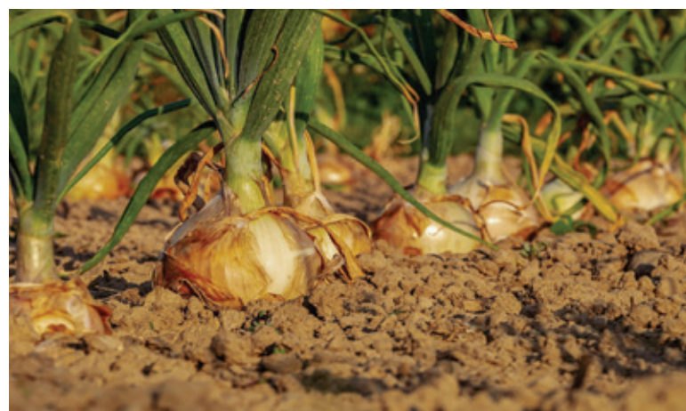
Cibuľu si dopestujeme aj v našej záhrade.

Cibuľa má vysoký obsah vitamínu C, vitamínov B1, B2, provitamínu A, obsahuje aj zinok, draslík, železo, selén, fosfor, vápnik, síru a kyselinu askorbovú. Cibuľa pomáha proti kašľu, chrípke i prechladnutiu, dezinfikuje nos, ústa a hltan. Posilňuje tiež náš imunitný systém.