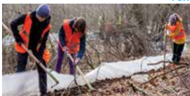
Inštalácia dočasných migračných zábran pre obojživelníky.

Viac informácií na webovej stránke ŠOP SR. » ren