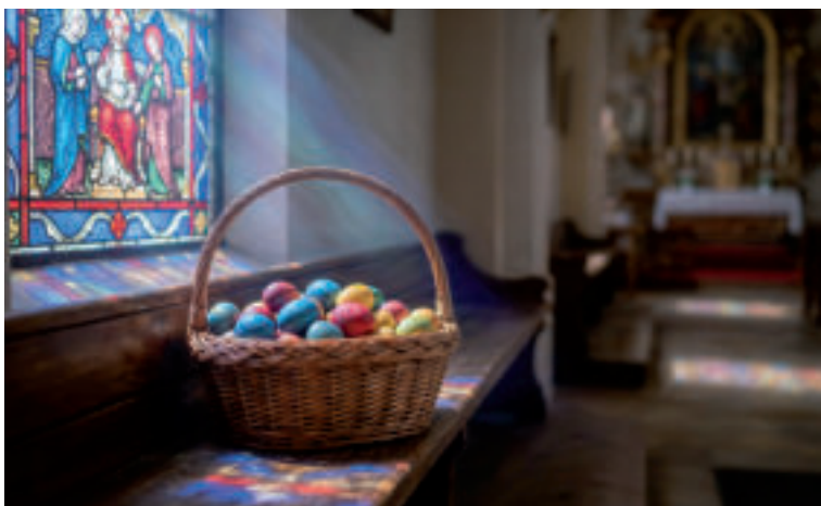
Súčasťou Veľkonočných sviatkov je aj posvätenie košíkov s jedlom.

Veľký piatok je kresťanský sviatok pripomínajúci ukrižovanie Ježiša Kris-