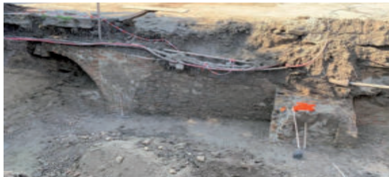
Park Malinovo - archeologické objavy.

Archeologický výskum je súčasťou širšieho projektu obnovy historického parku, ktorý realizuje BSK. Cieľom revitalizácie je nielen obnova kultúrnej pamiatky, ale aj vytvorenie kvalitného verejného priestoru, ktorý bude reagovať na súčasné environmentálne výzvy. „Park v Malinove nie je len obyčajným kúskom zelene. Pôvodne zanedbaný priestor zmeníme na živé miesto, kde sa spája história, príroda