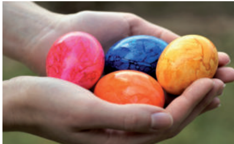
Dievčatá dávali šibačom za odmenu vlastnoručne maľované vajíčka.

Veľkonočný pondelok je posledný deň kresťanských sviatkov Veľkej noci a spája sa už tradične so šibačkou a oblievačkou. „Do polovice 20. storočia bolo na západnom Slovensku rozšírené šibanie korbáčom z ôsmich spletených vrbových prútov, na strednom a východnom Slovensku kúpanie a oblievanie dievčat mládenkami, či už namočenie do potoka, poliatie vodou z vedra či hrnčekom, alebo postriekanie voňavou vodou. Na juhozápadnom Slovensku boli známe obe obyčajové praktiky. Šibať a polievať či kúpať začínali buď už od nedele popoludnia alebo od polnoci na pondelok, alebo od pondelňajšieho svitania,“ prezrádza nám Elektronická encyklopédia CTLK pri SLUK-u.