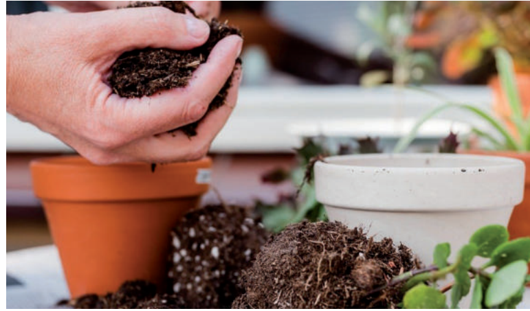
Je čas presádzať a množiť izbové rastliny.

Zo stonky pôvodnej rastliny odrežeme časť tesne pod takzvaným uzlom a vložíme ju do nádoby s vodou, alebo do vlhkého