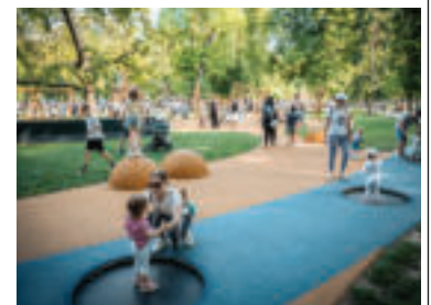
Nitriansky park.