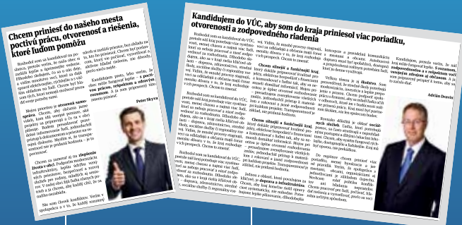
Štvrtstranový PR článok

Nástroj pre efektívnu komunikáciu s občanmi