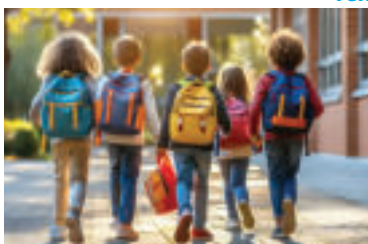
Ilustračné foto. zdroj foto syeda_saira-ai-generated pixabay

Nárok na dávku ošetrovné si po splnení podmienok môžu uplatniť napríklad aj starí rodičia. Zoznam ďalších rodinných príslušníkov, ktorí dávku môžu využiť spolu s podmienkami pre priznanie dávky, nájdete na webstránke Sociálnej poisťovne: https://www.socpoist.sk/kto-som/zivnostnik-szco/poziadat-o-davku/ako-poziadat-o-osetrovne?ref=814