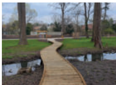
Vychádzka parkom vás očarí.

Historický kaštielsky park v Stupave pochádzajúci z 18. storočia prešiel v súčasnosti najrozsiahlejšou obnovou za posledné desaťročia. Bratislavský samosprávny kraj (BSK) sa v roku 2022 pustil do komplexnej revitalizácie, ktorej cieľom bolo vrátiť parku jeho pôvodný anglický charakter, posilniť jeho