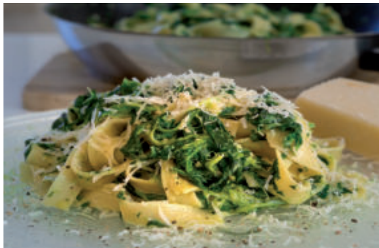
Cestoviny so špenátom zvládnete pripraviť za pár minút.

Špenát zbierame ešte pred kvitnutím, v čase, keď jeho listy dorastú do veľkosti približne 10 až 15 cm. Čerstvý a neumytý vydrží v chladničke niekoľko dní. Ak sa nám ho urodilo viac, môžeme si ho aj zamraziť. „Pri nákupe čerstvého špenátu treba dbať na to, aby listy boli bez škvrn. Skladovaný by mal byť len niekoľko dní, a to najlepšie v chladničke,“ radí MUDr.Šranková.