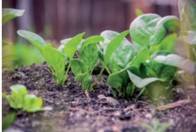
Špenát si môžeme dopestovať aj v našej záhrade.

Špenát nie je náročný na pestovanie, nemá však veľmi rád príliš vysoké teploty. Výhodou tejto zdravej zeleniny je, že ju môžeme vysievať až trikrát do roka. Prvý, takzvaný jarný výsev môžeme realizovať koncom marca až začiatkom apríla a úrodu by sme mali zberať v máji. Druhým obdobím, kedy môžeme špenát siať, je polovica augusta a na úrodu sa môžeme tešiť približne koncom septembra. Zimný špenát sa vysieva koncom septembra až v októbri a úrody sa dočkáme skoro na jar.