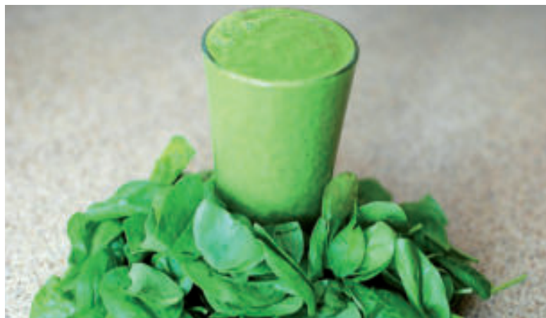
Špenátové smoothie je plné vitamínov.