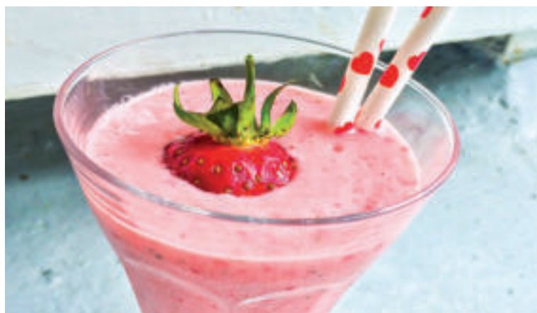
Jahody sa hodia aj na prípravu osviežujúcich nápojov.

Keďže pri tepelnej úprave dochádza k stratám mnohých cenných živín, najlepšie je jahody konzumovať čerstvé, prípadne ako súčasť ovocných či zeleninových šalátov. Tiež si ich môžete pridať do jogurtu či kaše