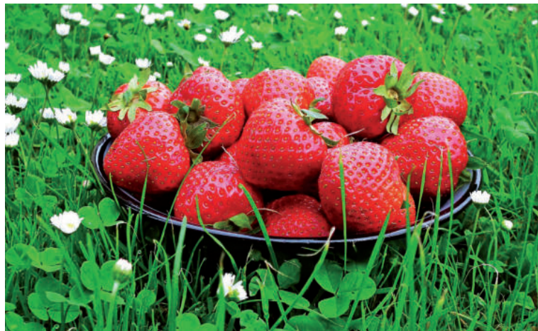
Jahody sú chutné a plné vitamínov.

• Črepníky naplňte až po kraj substrátom. Rastliny vyberte z plastových nádob, v ktorých ste ich zakúpili, vysaďte ich do rovnakej hĺbky, v akej boli zasadené v pôvodných nádobách a zalejte.