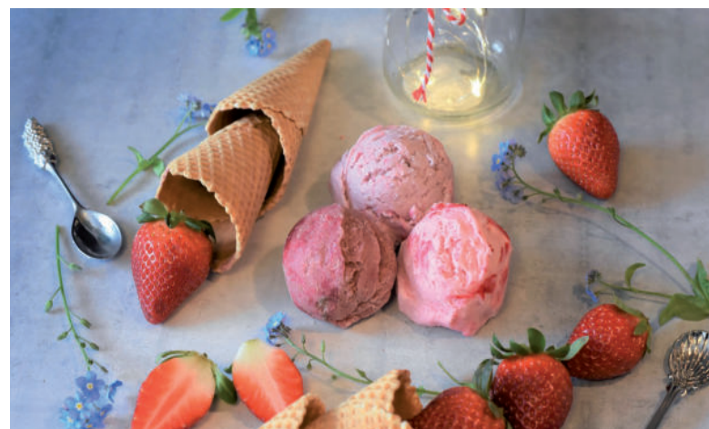
Z jahôd si môžeme pripraviť aj domácu zmrzlinu.