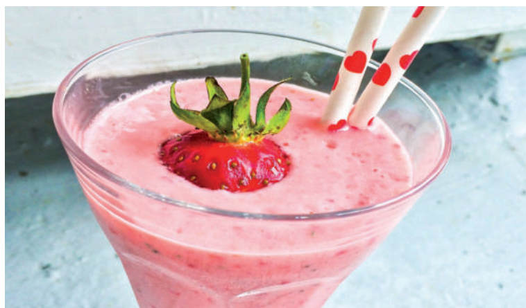
Jahody sa hodia aj na prípravu osviežujúcich nápojov.

Keďže pri tepelnej úprave dochádza k stratám mnohých cenných živín, najlepšie je jahody konzumovať čerstvé, prípadne ako súčasť ovocných či zeleninových šalátov. Tiež si ich môžete pridať do jogurtu či kaše